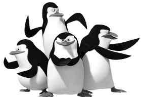
Kom maar op, maat.....!